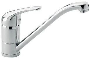
Mitigeur S1000 - RO 8443 002